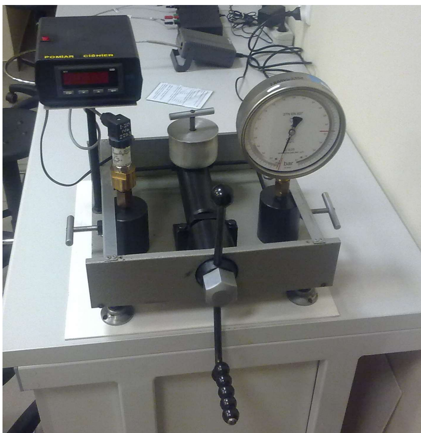
Stanowisko badawcze – sprawdzanie manometru

Sprawdzanie manometrów przeprowadzone zostanie na stanowisku badawczym przedstawionym na rys 4. Jest to praska hydrauliczna z zamontowanym manometrem wzorcowym i sprawdzanym przetwornikiem ciśnienia.