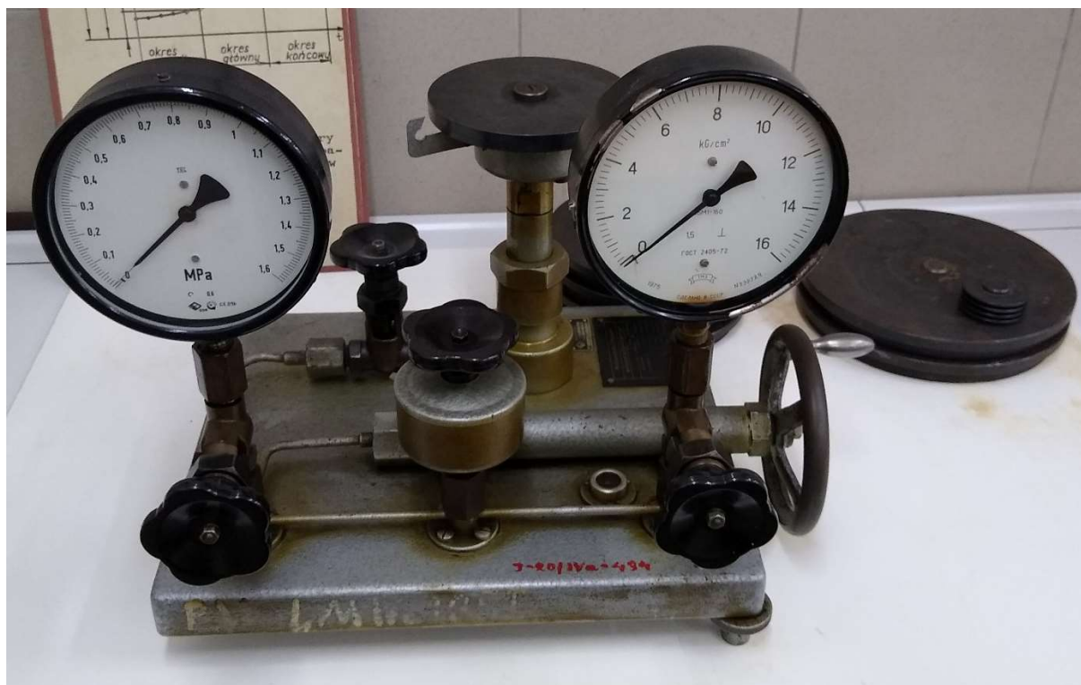
Stanowisko badawcze - wzorcowanie manometru

Wzorcowanie manometrów przeprowadzone zostanie na stanowisku badawczym przedstawionym na rys 3. Jest to praska Ruchholza z zamontowanymi dwoma manometrami poddany wzorcowaniu za pomocą manometru tłokowego.